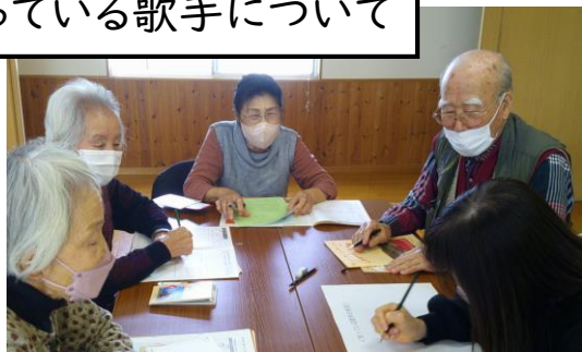
昭和を代表する有名な歌手