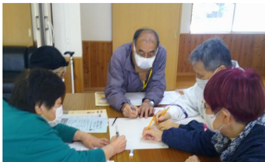
長崎出身の有名な歌手

今までこうして話すことが無かったので、今日はみんなで色々話せて とても 楽 しくて良かった!